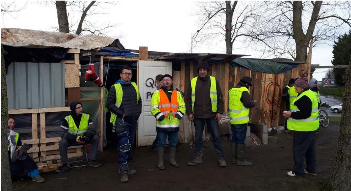
Gilets jaunes de l'agglomération cherbourgeoise, rond-point de Penesme, 9 décembre 2018

laborieuse et ne l'aborde plus que de l'extérieur, de manière misérabiliste ou populiste, charitable ou moralisatrice, jusqu'à l'invisibilité par la disparition même de la notion de classe 19 .