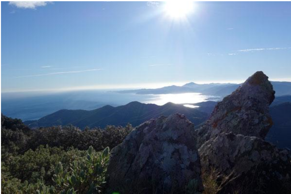
Col de Rumpissar, renommé « col de la Liberté » à la frontière franco-espagnole sur le sentier des résistants « Walter Benjamin » reliant Banyuls à Portbou, 2015

C'est une manière de « vaincre le capitalisme par la marche à pied » 38 pour reprendre la phase de Walter Benjamin fuyant le nazisme 39 sur le chemin du col de la Liberté 40 .