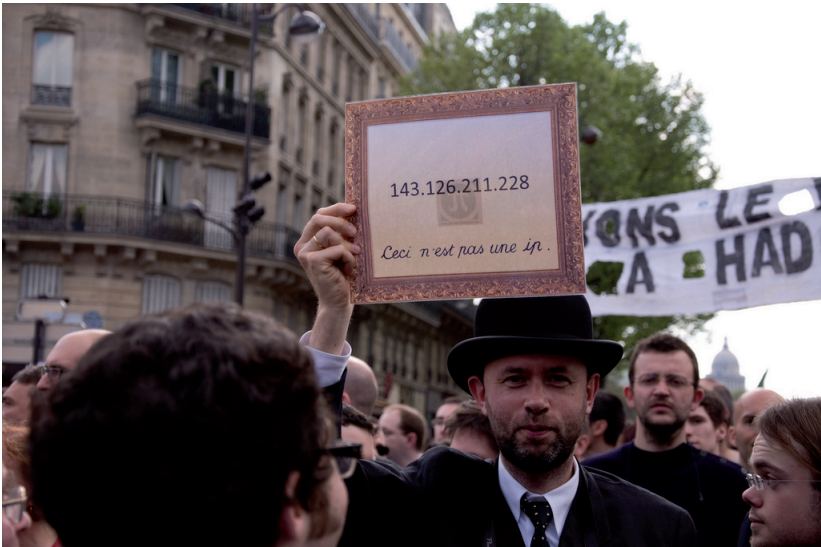
Un admirateur de René Magritte...