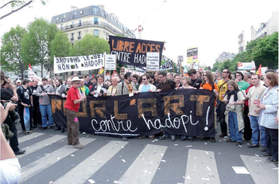
Une véritable réussite